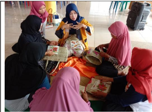
Foto : Bimtek Peningkatan Produktifitas dan daya saing Kerajinan Tangan Daun Mengkuang di Desa Delas

Untuk bantuan alat pendukung produksi bagi UMKM melalui dana DID (Dana Insentif Daerah) tambahan 2020.