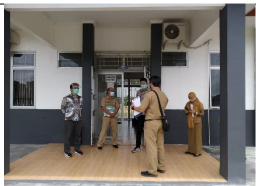
Foto : pemeriksaan terhadap ruang belajar terhadap manajemen mutu sertifikat ISO 9001:2015 yang dilaksanakan oleh PT. AQC Sertifikasi Indonesia