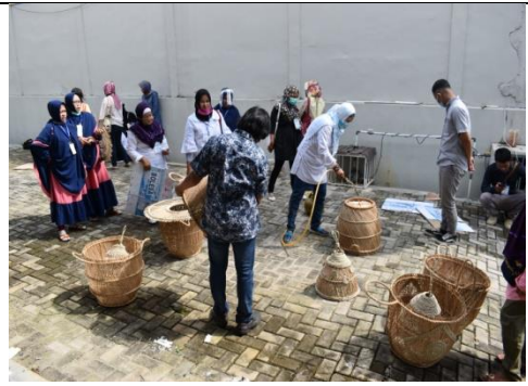
Foto : Pelatihan Kewirausahaan Bidang Keterampilan Usaha Produktif angkatan 4