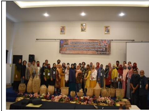
Foto : Peserta Pelatihan Kewirausahaan Bidang Keterampilan Usaha Produktif angkatan 4

Kegiatan dilaksanakan oleh Balatkop UKM Dinas Koperasi Usaha Kecil dan Menengah Provinsi Kepulauan Bangka dengan alokasi anggaran sebesar Rp.628.795.160,- dan realisasi anggaran sebesar Rp.563.496.585,- atau 89.62%. Keluaran kegiatan ini adalah 120 peserta pelatihan kewirausahaan bidang keterampilan usaha produktif, 75 peserta pelatihan prasertifikasi dan uji kompetensi dewan pengawas syariah koperasi, dan 25 orang peserta pelatihan sertifikasi dan uji kompetensi dewan pengawas syariah koperasi.