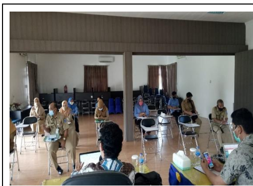
Foto : Audit sertifikat surveillance ISO 9001:2015 yang dilaksanakan oleh PT. AQC Sertifikasi Indonesia

Kegiatan Peningkatan Mutu Pelatihan Perkoperasian dan UKM yang dilaksanakan oleh UPTD Balai latihan Koperasi UKM Dinas Koperasi Usaha Kecil dan Menengah Provinsi Kepulauan Bangka Belitung dengan alokasi anggaran sebesar Rp.67.637.000,- dan realisasi anggaran sebesar Rp63.052.500,- atau 93.22%. Keluaran kegiatan ini adalah 1 Sertifikat Audit Surveillance dengan hasil SDM Koperasi Terlatih 10,32 % dan UKM Terlatih 1,12 % dengan mamfaat yang didapat penerapan Penerapan Mutu Pelatihan KUKM berjalan 100 %