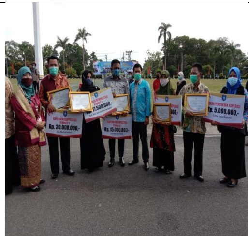
Foto : Pemberian Penghargaan kepada Koperasi dan Tokoh Penggerak Koperasi Berprestasi pada saat Hari Jadi Provinsi Kepulauan Bangka Belitung