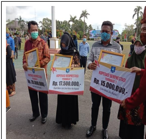
Foto : Pemberian Penghargaan kepada Koperasi Berprestasi pada saat Hari Jadi Provinsi Kepulauan Bangka Belitung

Kegiatan dilaksanakan oleh Dinas Koperasi Usaha Kecil dan Menengah Provinsi Kepulauan Bangka Belitung dengan alokasi anggaran sebesar Rp 102.187.300,- dan realisasi anggaran sebesar Rp 97.165.900,- atau 95,09%. Keluaran kegiatan ini adalah Pemberian Penghargaan kepada 3 Koperasi Berprestasi dan 2 Tokoh Penggerak Koperasi Tingkat Provinsi di Provinsi Kepulauan Bangka Belitung.