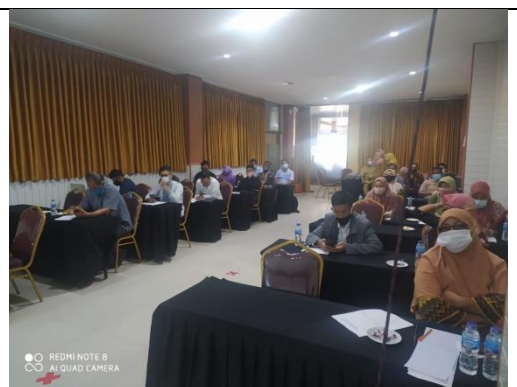
Foto : Kegiatan Peningkatan Kualitas dan Kuantitas Rapat Anggota Tahunan (RAT)