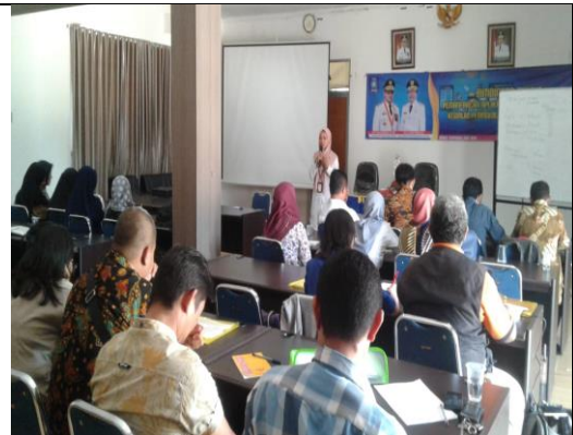
Foto : Bimtek Pemanfaatan Aplikasi Keuangan bagi Koperasi