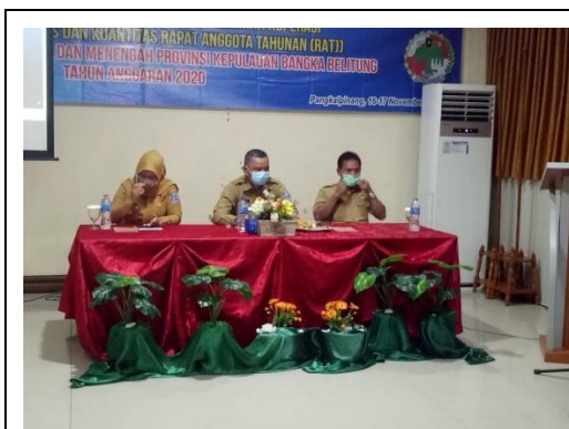
Foto : Kegiatan Peningkatan Kualitas dan Kuantitas Rapat Anggota Tahunan (RAT)

Keluaran kegiatan ini adalah terbentuknya Koperasi baru sebanyak 2 Unit dan tersosialisasinya tentang Peningkatan kualitas dan kuantitas Rapat Anggota Tahunan bagi 30 Pengurus Koperasi.